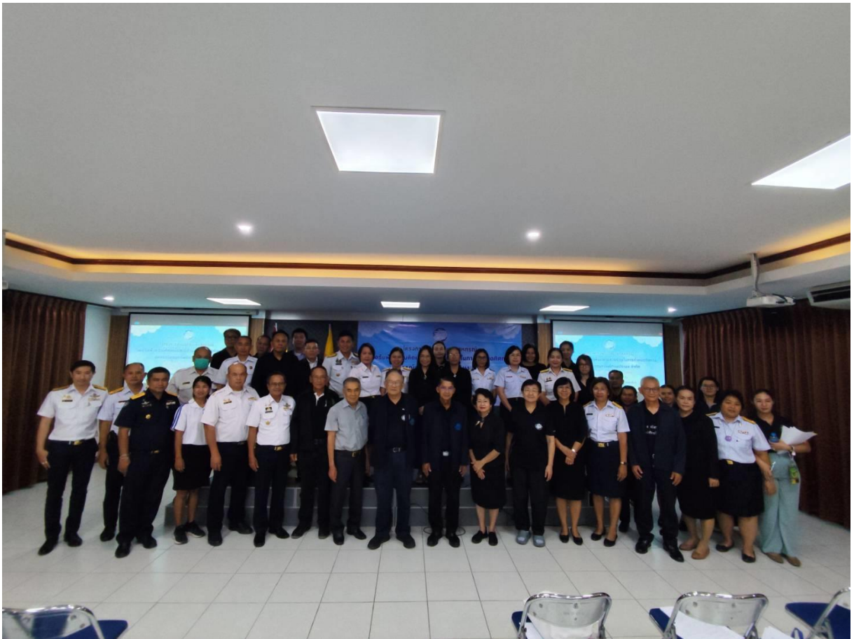
ผนวก 2 ภาพแสดงการประชุมผู้แทนสมาชิกสหกรณ์ออมทรัพย์กรมประมง จำกัด เมื่อวันที่ 15 ธันวาคม 2568 ณ ห้องประชุมชั้น 3 สอป.